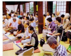
無量壽寺会場での聴聞者

たつもりで決めつけ、その善悪に苦しんでいたものが、日常の分別を超え、定まらなくなるところに弥陀の本願が聞こえてくる」と悪人正機について説かれました。他会場でも、各講師が自身の出遇われた親鸞聖人のお言葉を講題に、難解な文章も解りやすく、時に笑いの交えてお話し下さり、人智の過信が問われる今、苦しみ悲しみを