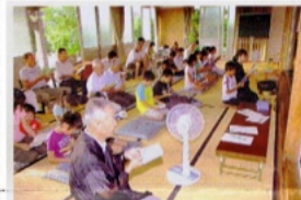
子供と大人が一纏に

市子町の願海寺では、地域子供会と協力し、大人も加わる「正信偈練習会」が初めて開催された。8月22日から26日までの5日間、早朝のラジオ体操の後、子供・大人の有志が願海寺の本堂に集まり、一緒に正信偈の練習をするもので、取材の25日には40名程の参加があった。子供たちは、きちっと正座をして大きな声で刷れない正信偈の練習に励んでいた。なかでも、同寺の若坊守の隣に座り、御本尊の真ん前で調声を努める子供の姿がとても印象的であった。子供が、家族とではな