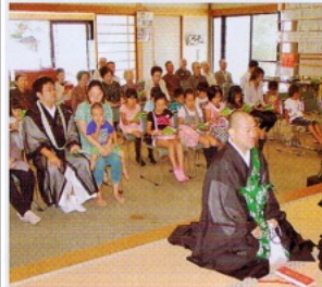
前列に子供助音の皆さん

秋季彼岸会 厳しい残暑を吹き飛ばす如き台風一過、堂内を心地よい秋風が吹き抜けるなか、9月22・24日の3日間にわたり、秋季彼岸会・永代経法要が厳修されました。 この法会には、今回、子供たちが助音として初めてお勤めに参加したことが特筆されます。 8月に行つた別院での助音練習会をはじめ、崇敬区